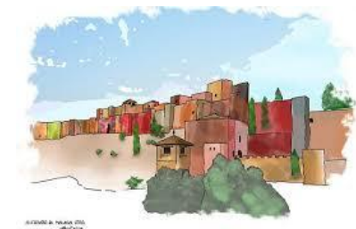
Alcazaba de Málaga

Reise nach Málaga vom 1. oder 2. bis 13. Oktober 2024. Das genaue Datum der Reise wird so bald wie möglich bekannt gegeben.